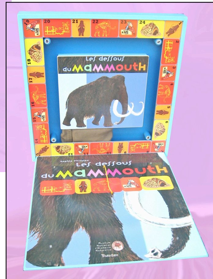
La malle ouverte.