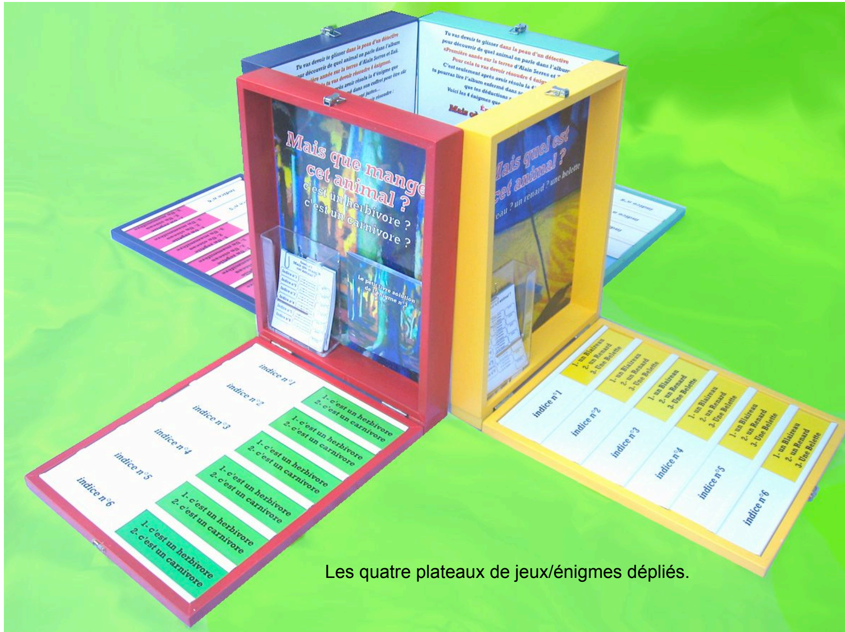
Les quatre plateaux de jeux/énigmes dépliés.