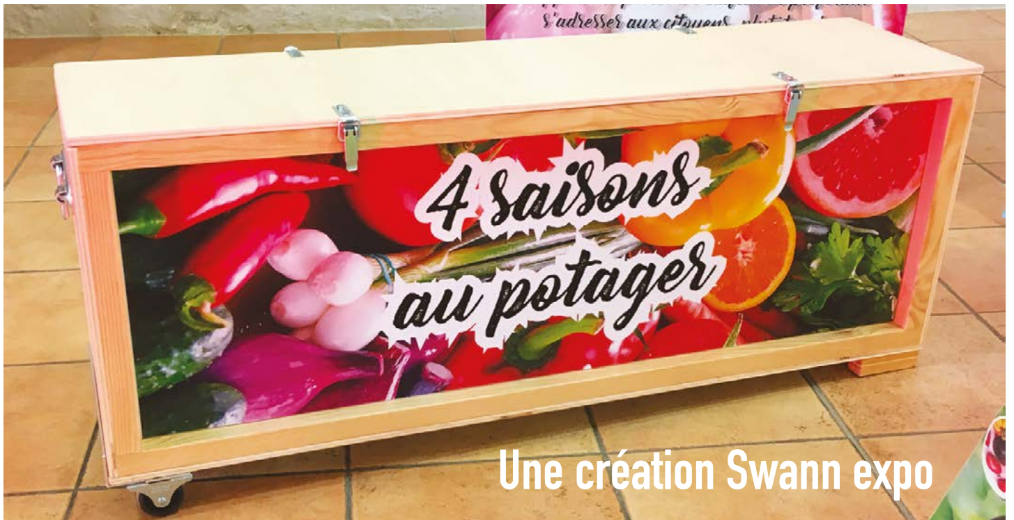
Une création Swann expo